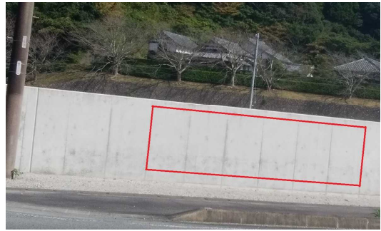
この壁面に設置します